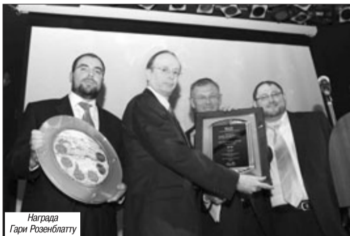
Награда Гари Розенблатту